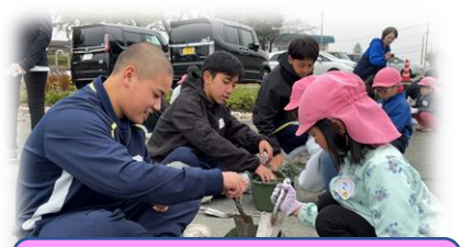
緑とお友達プロジェクト